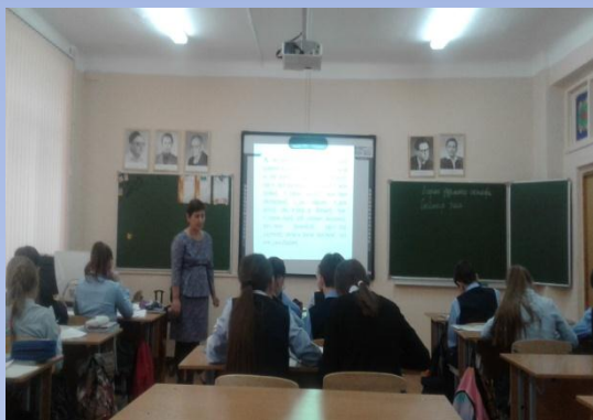
11.10.2019 Гимназия №5