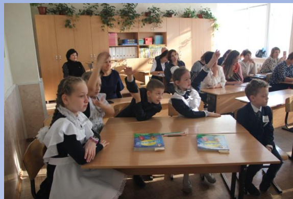
24.10.2019 Лицей №9 им. А.С. Пушкина Осиновская гимназия