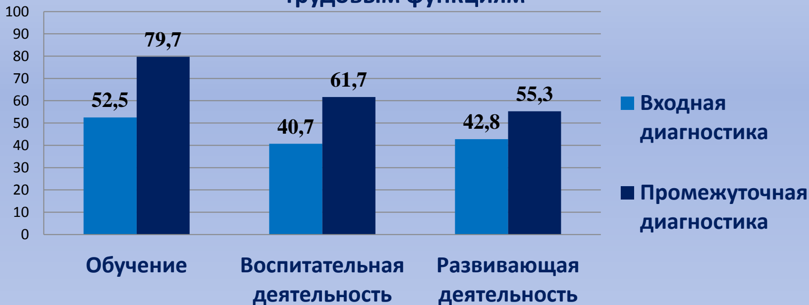
Степень соответствия профессиональному стандарту по трудовым функциям