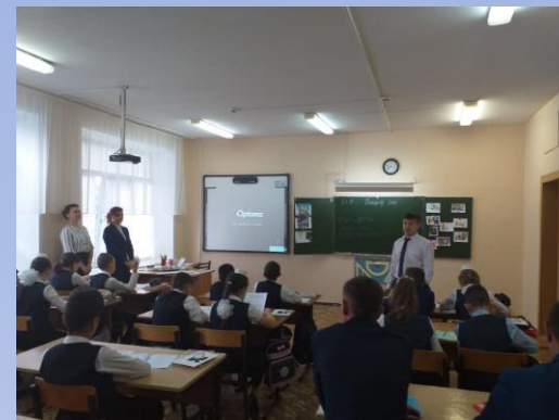
17.01.2019 Осиновская гимназия